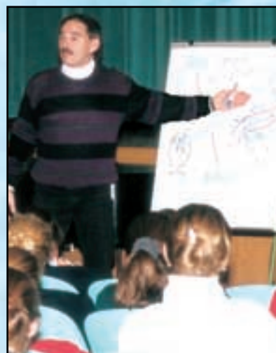
Un conférencier de Narconon, qui a fait connaître à des milliers de jeunes gens et d'adultes la vérité sur les drogues.

Ce sont des centaines de milliers d'enfants qui connaissent maintenant la vérité sur les drogues grâce à ce programme éducatif de prévention.