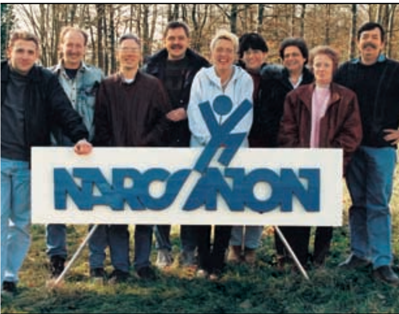
Narconon Huddingen, le premier centre de traitement en résidence suédois, a ouvert ses portes en 1972. Selon une étude réalisée en 1981, Narconon obtient un taux de réussite de 78 %.

dépendance et établit dans la prison un programme pour aider les autres à sortir de la drogue. Il appela ce programme Narconon, ce qui signifie Non aux drogues .