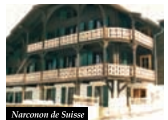
Narconon de Suisse