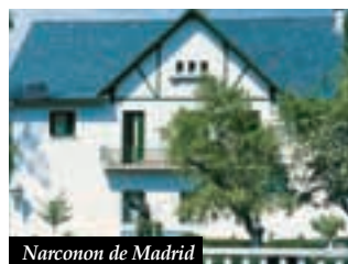
Narconon de Madrid

Les échecs répétés de réhabilitation des toxicomanes ont amené beaucoup d'observateurs à conclure que la dépendance aux drogues est une maladie incurable, et que les toxicomanes doivent se résoudre à vivre avec une maladie qui va les accabler toute leur vie. D'autres plaident pour des drogues de