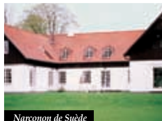
Narconon de Suède